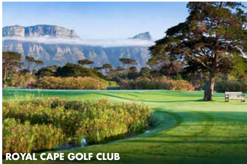
ROYAL CAPE GOLF CLUB