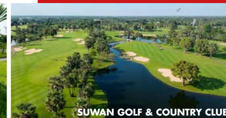
SUWAN GOLF & COUNTRY CLUB