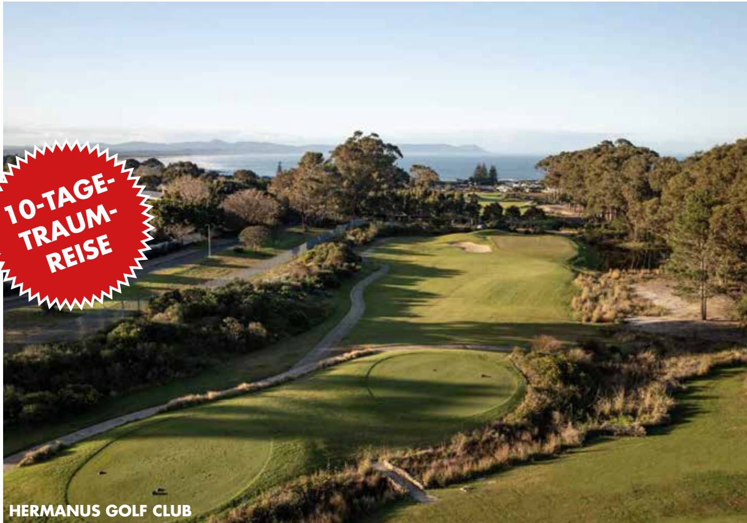
HERMANUS GOLF CLUB