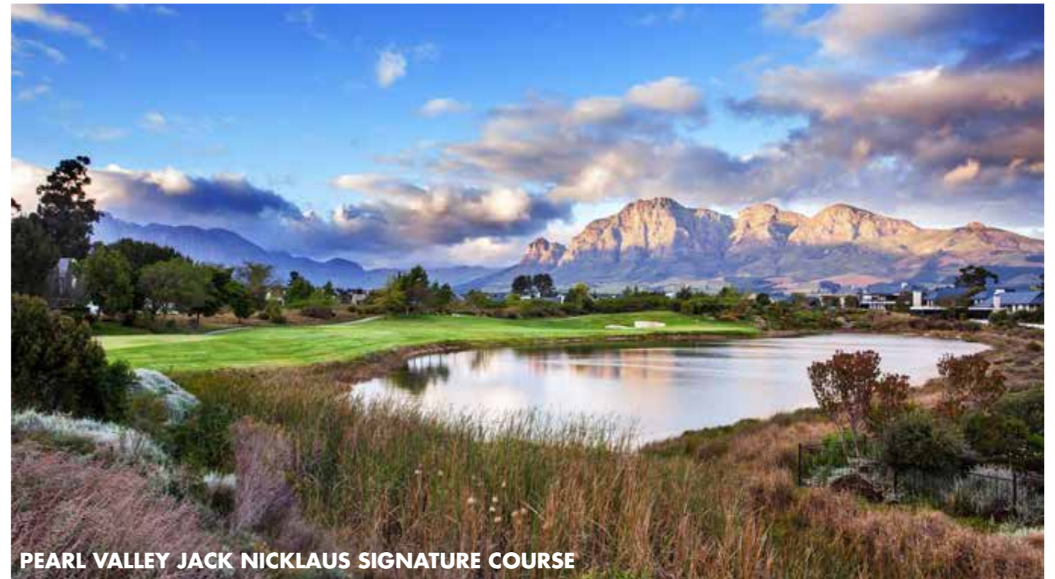
PEARL VALLEY JACK NICKLAUS SIGNATURE COURSE

Dieser im Tal der Constantia Winelands gelegene und 1997 eröffnete Kurs befindet sich auf dem ältesten Weingut des Landes (1682). Der von Peter Matkovich konzipierte Championship Course wird als einer der schönsten Plätze in der Region um Kapstadt bezeichnet und bietet seinen Gästen unter anderem das größte Single Green des Landes und insgesamt eine herausfordernde Partie mit herrlichem Blick auf den Devil's Peak, einem der Gipfel des Tafelbergs.