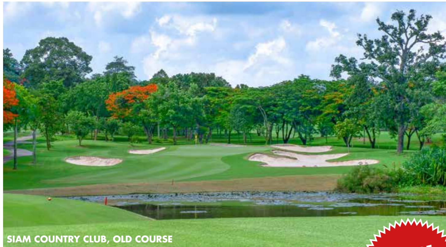
SIAM COUNTRY CLUB, OLD COURSE

So Sofitel Bangkok****, Centara Maris Resort Jomtien****