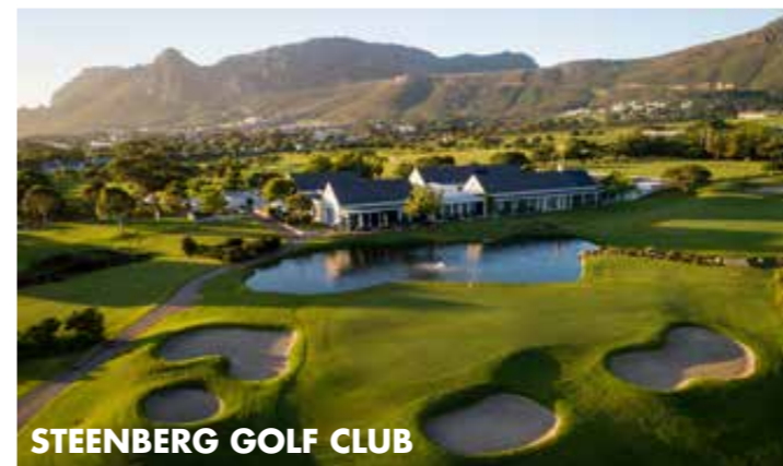
STEENBERG GOLF CLUB