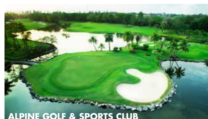
ALPINE GOLF & SPORTS CLUB