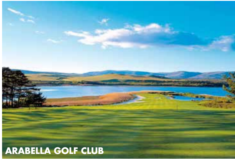
ARABELLA GOLF CLUB