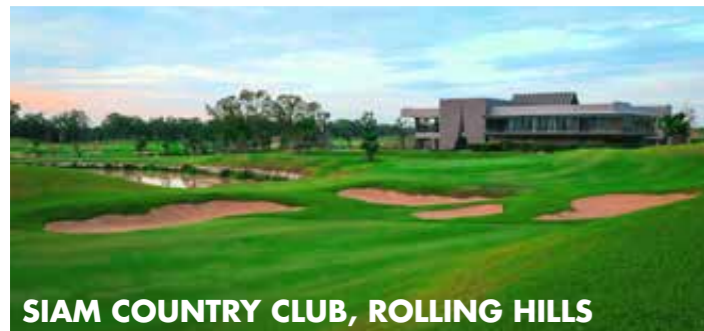
SIAM COUNTRY CLUB, ROLLING HILLS