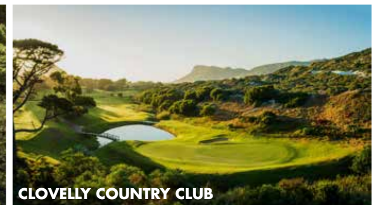
CLOVELLY COUNTRY CLUB