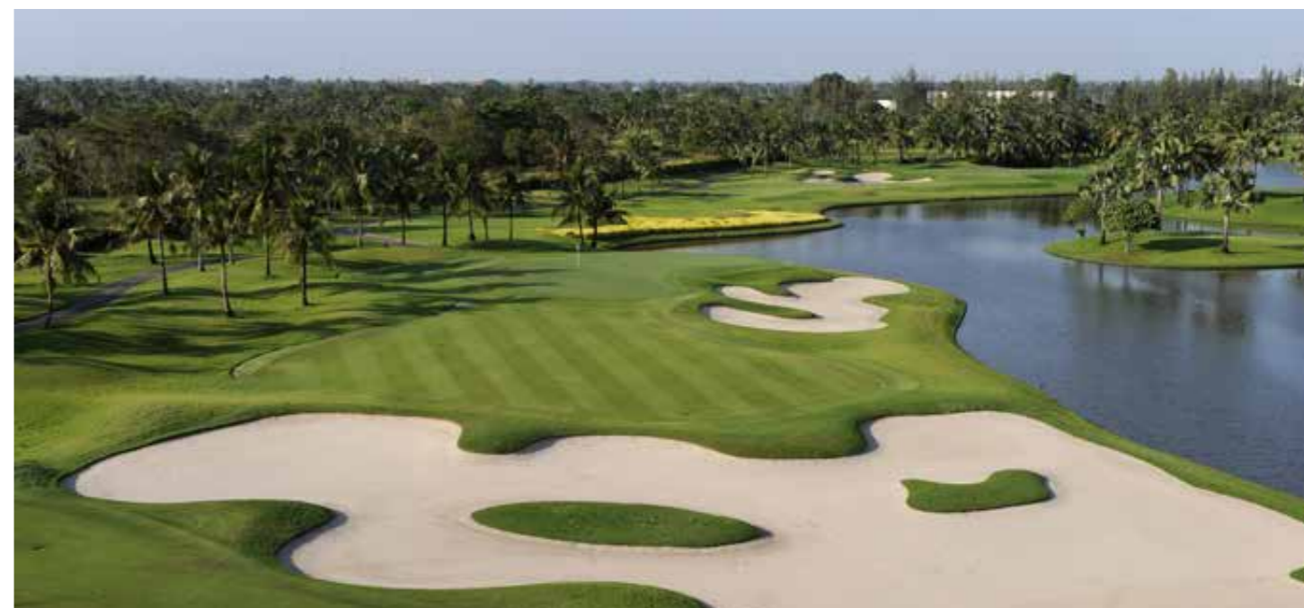
THAI COUNTRY CLUB

Der erstklassig gepflegte, von Denis Griffiths designte und 1996 eröffnete Par-72 Platz beeindruckt mit großer Abwechslung, zahlreichen Wasserhindernissen und Sandbunkern. Die Grüns sind teilweise erhöht und wellig, so dass für einen guten Score die Putts entscheidend werden können. Der vom Peninsula Hotel Bangkok geführte private Thai Country Club wird regelmäßig zu einen der fünf besten Golfplätze Asiens gewählt.