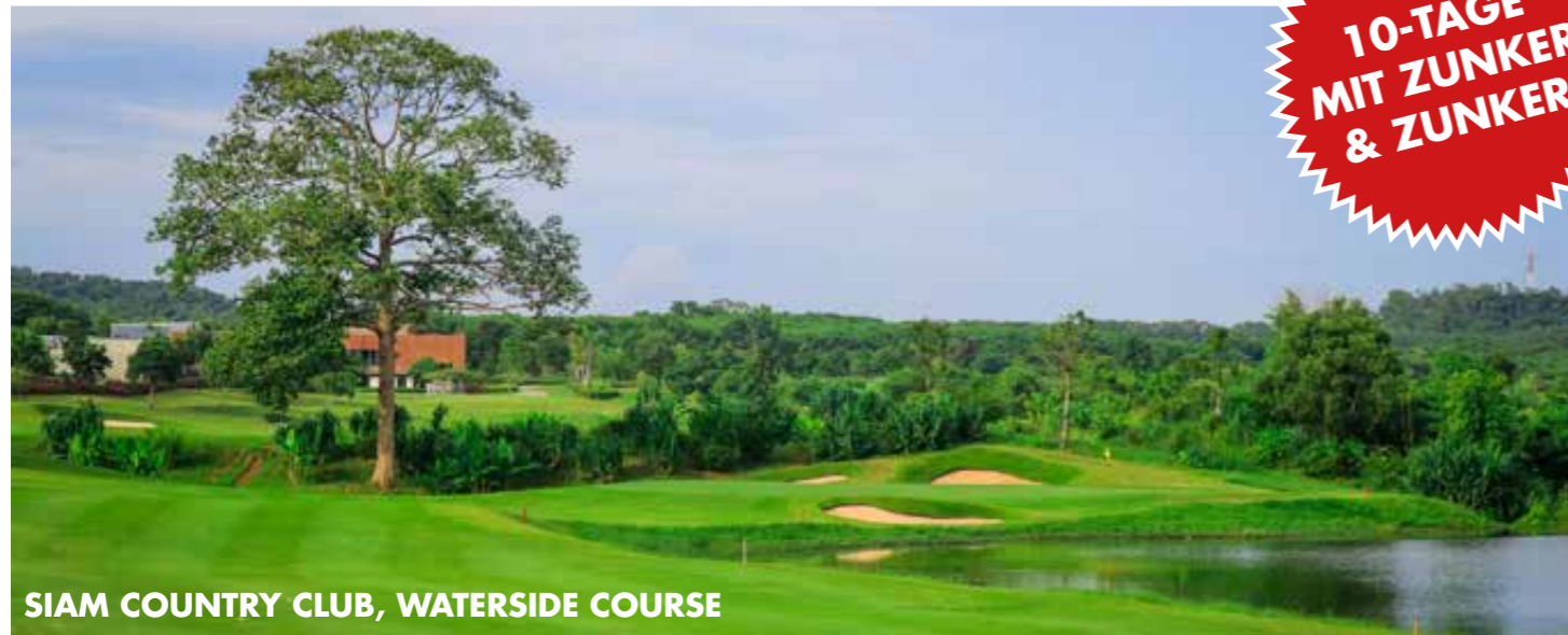
SIAM COUNTRY CLUB, WATERSIDE COURSE