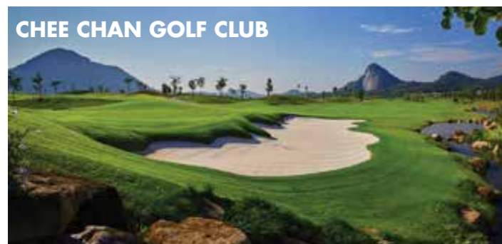
CHEE CHAN GOLF CLUB