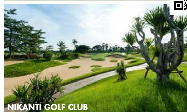
NIKANTI GOLF CLUB